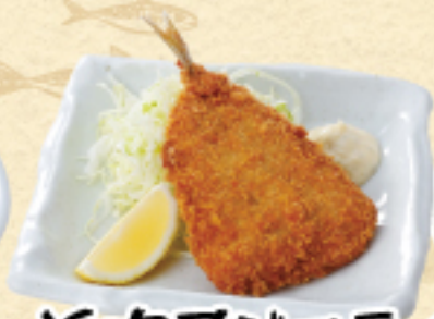
近海アジフライ 380(税込418円)