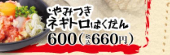
やみつき ネギトロはくたん 600(税込660円)