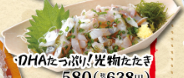
DHAたっぷり! 光物たたき 580(税込638円)