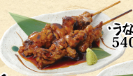
うなぎ肝串 540(税込594円)