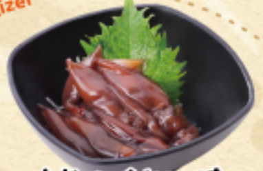
ホタルイカ沖漬け 480(税込528円)