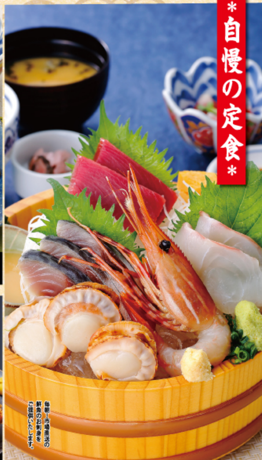
本日のお刺身定食 ご飯 味噌汁 お漬物 小鉢 1580 (税込 1738 円)