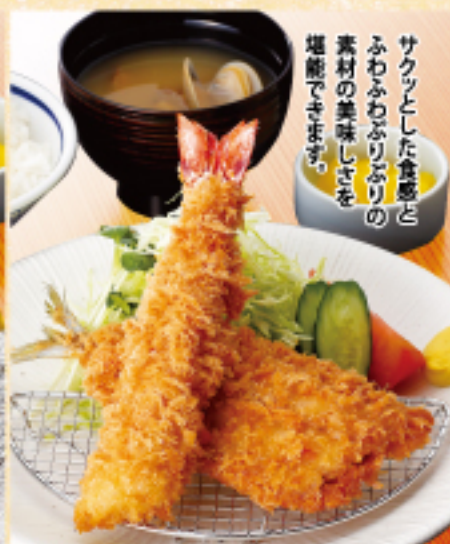
アジフライと海老フライ定食 ご飯 味噌汁 お漬物 1280 (税込 1408 円)