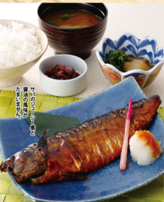
焼きトロさば定食 ご飯 味噌汁 お漬物 小鉢 1020 (税込 1122 円)