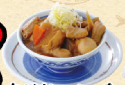
店仕込みもつ煮 450(税込495円)