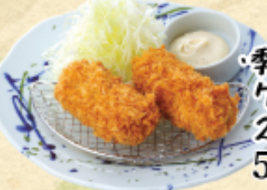
季節の クリームコロッケ 2ヶ 560(税込616円)