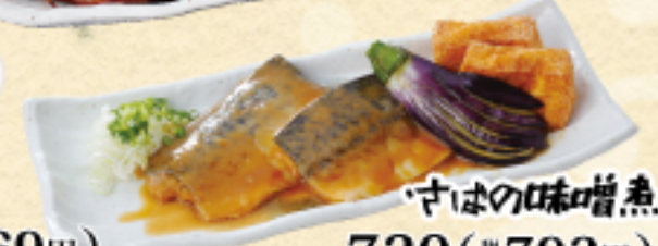
さいほの味噌煮 720(税込792円)