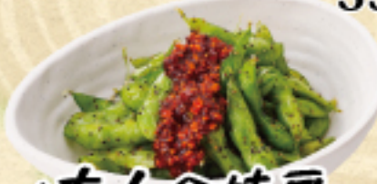
大人の枝豆 490(税込539円)