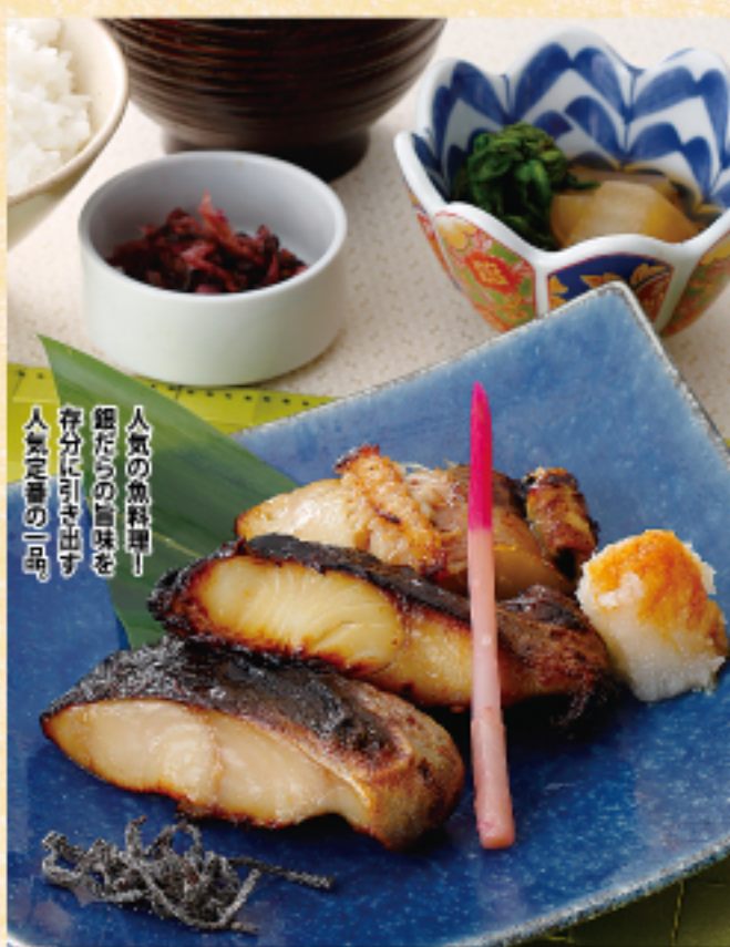
銀だら西京焼き定食 ご飯 味噌汁 お漬物 小鉢 1480 (税込 1628 円)