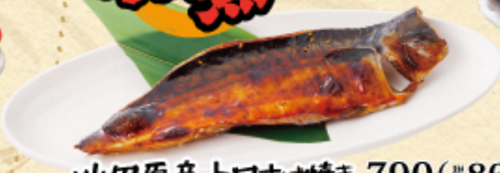
小田原産 トロさは焼き 790(税込869円)