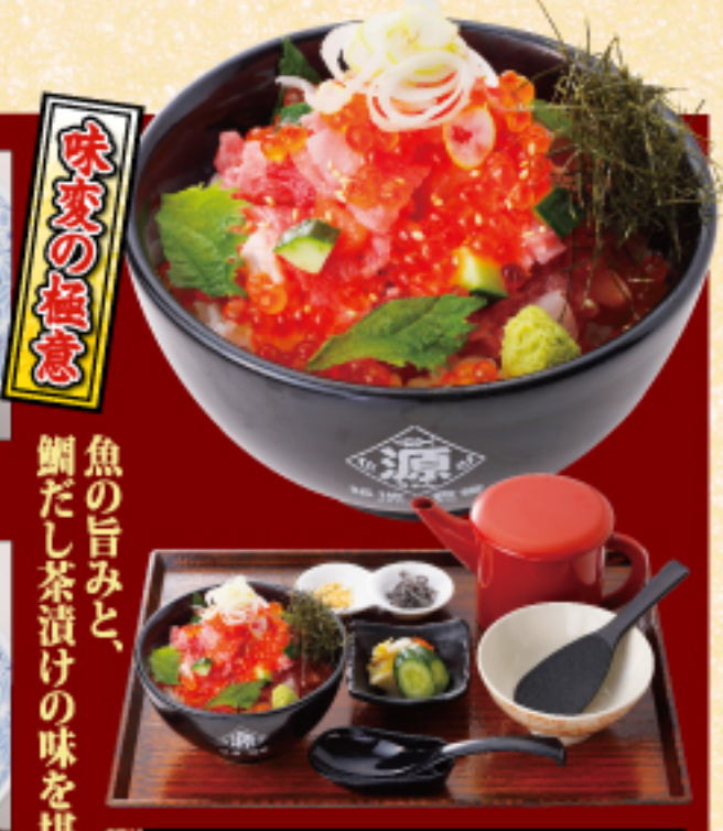
特選贅沢丼【いくら入り】 お漬物 鯛だし 1480 (税込 1628 円)