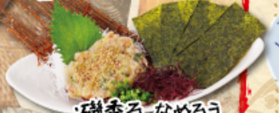
磯香る なめろう 580(税込638円)