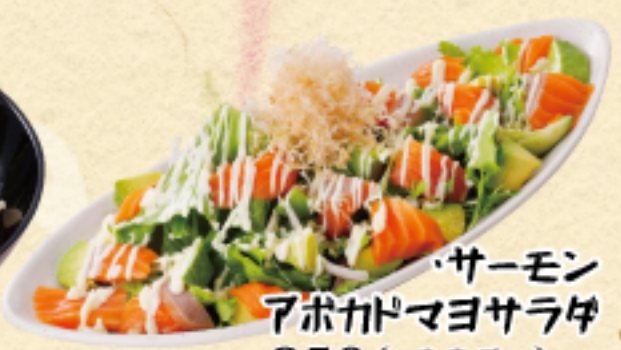
サーモン アボカドマヨサラダ 850(税込935円)