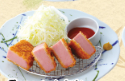
厚めのハムカツ 490(税込539円)