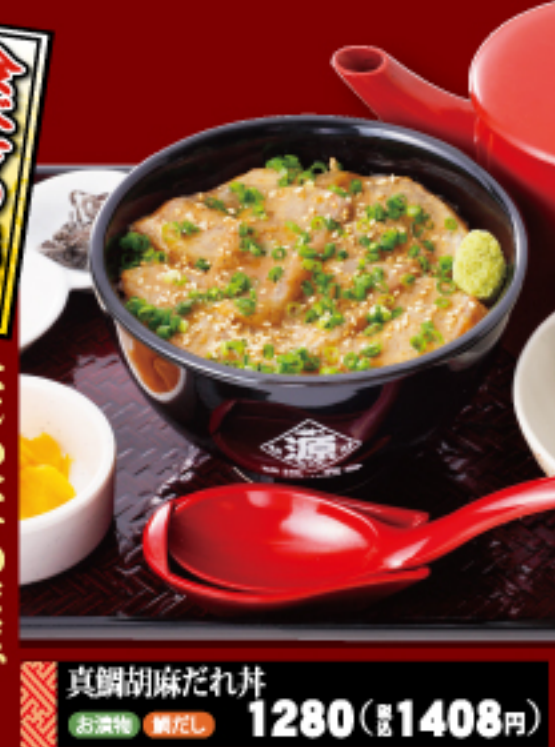
真鯛胡麻だれ丼 お漬物 鯛だし 1280 (税込 1408 円)