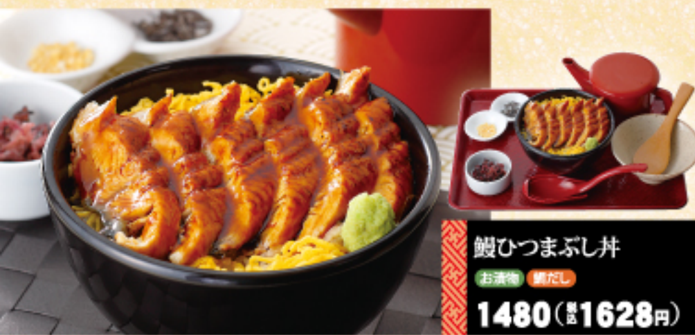
鰻ひつまぶし丼 お漬物 鯛だし 1480 (税込 1628 円)