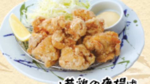
若鶏の唐揚げ 650(税込715円)