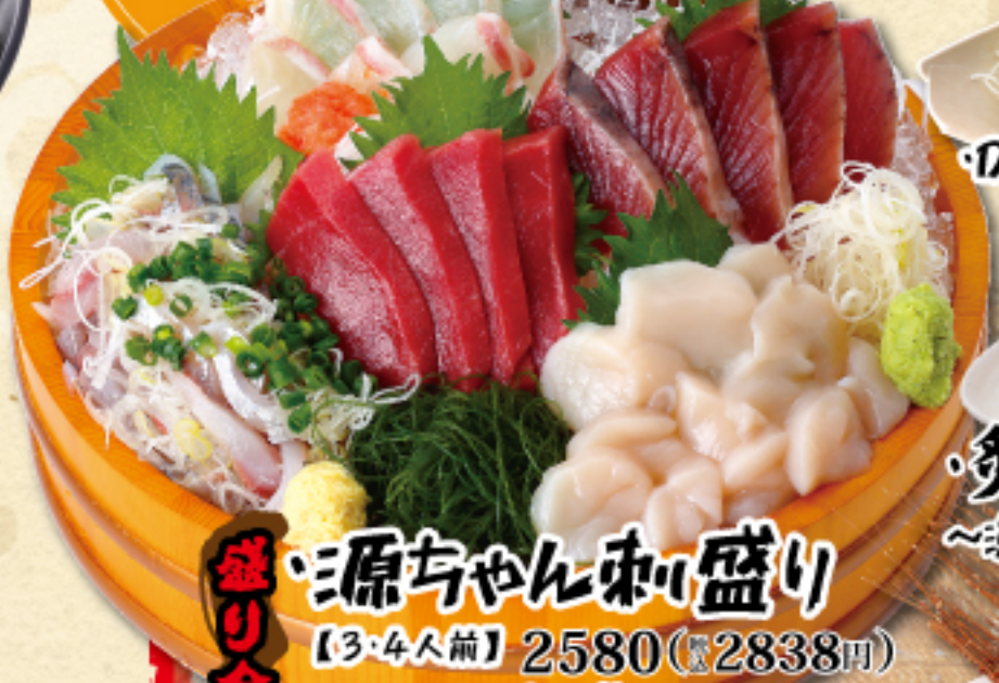
源ちゃん刺盛り 【3・4人前】2580(税込2838円)