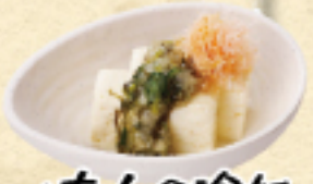
大人の冷奴 390(税込429円)