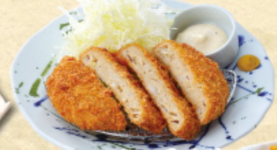
まぐろのメンチカツ 550(税込605円)