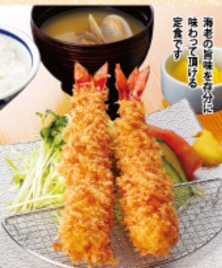
特大海老フライ定食 ご飯 味噌汁 お漬物 1380 (税込 1518 円)