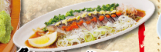
炙りめさはポン酢 〜漁師風〜 890(税込979円)