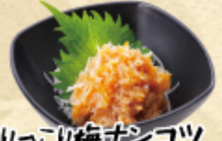
こりっこり梅おんごり 480(税込528円)