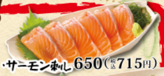
サーモン刺し 650(税込715円)