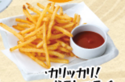
カリッカリ! ポテトフライ 390 (税込429円)