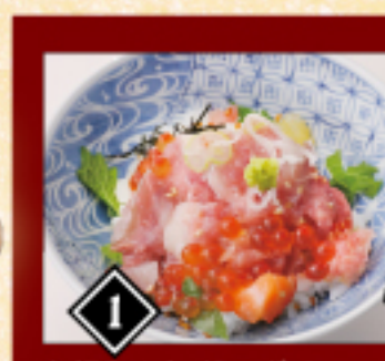
1 お好みのタイミングで小茶碗に具材をうつして