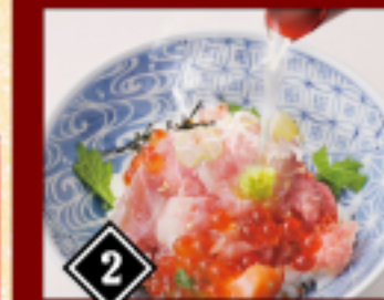
2 蒸味と鯛だしをかけお茶漬けにして