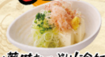
薬味たっぷり! 冷奴 290(税込319円)