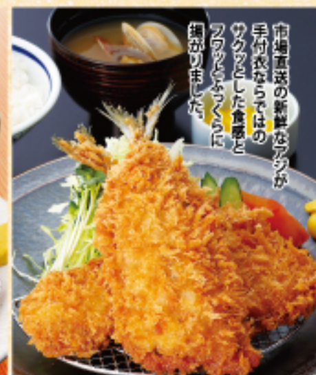
アジフライ定食 ご飯 味噌汁 お漬物 1020 (税込 1122 円)