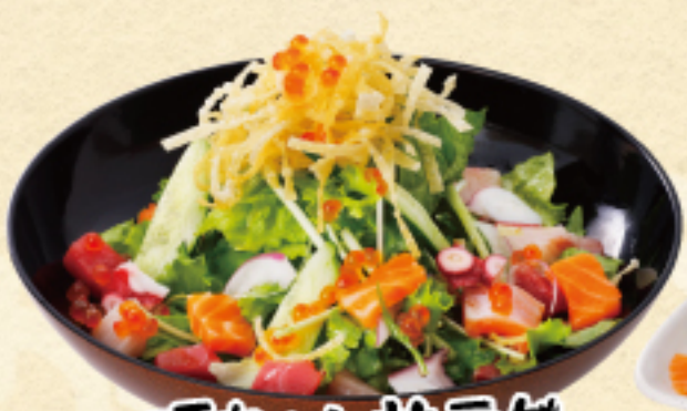
源ちゃんサラダ 750(税込825円)