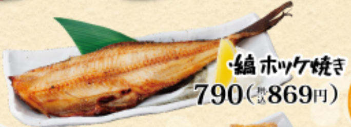
鱈ホッケ焼き 790(税込869円)