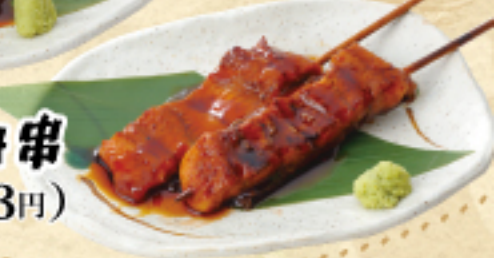
うなぎ短冊串 630(税込693円)