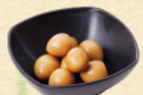
うずらとんぐり 390 (税込429円)