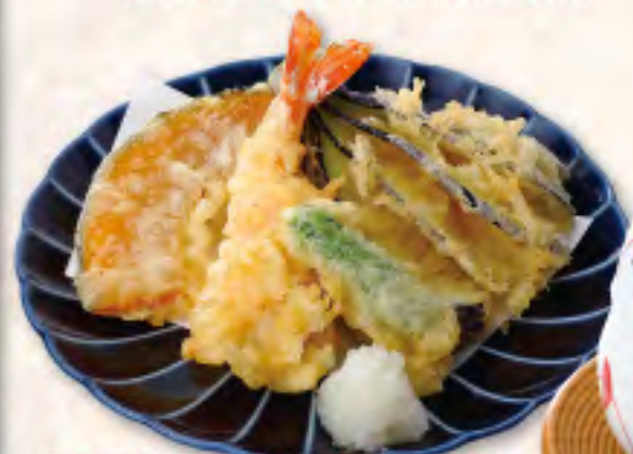
天ぷら盛合せ 450(税495円)