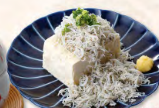
しらすやっこ 280(税308円)