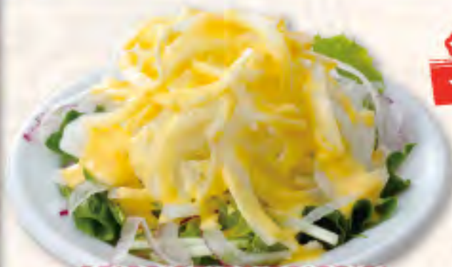
オニオンサラダ 180(税198円)