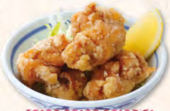
ちよい唐揚げ 380(税418円)