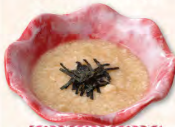
だしわりとろろ 280(税308円)