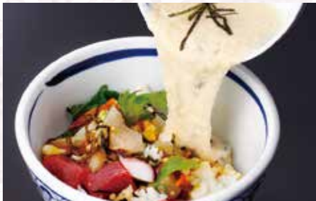
お好みで特製ウコとろろをかけて お召上がりください。