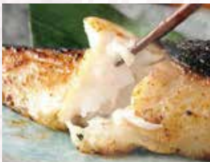
自家製味噌で熟成

自家製味噌で熟成し、 銀だらの旨さを引き出した 極上の西京漬けの逸品です。 小鉢の海鮮とろろと 味噌汁が 食欲をかきたてます。