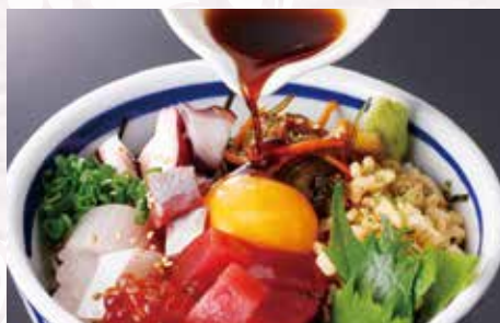
だし醤油ををかけ玉子をくずして お召上がりください。

松前漬けと 天かすを程よく残し 特製うにとろろと だし醤油をかけ、 井ぶりの旨味を 余すことなく堪能できます