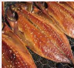
1つ1つ丁寧に手作業で 作られています。