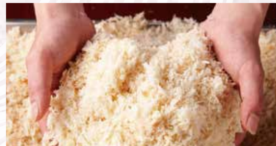
こだわり生パン粉がサクツと感を上げます。

鮮度香る市場直送のアジが 手付衣ならではのサクツとした食感と フワツとふっくら揚がりました。 自信をもっておすすめする アジフライです