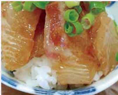
自家製ごまだれが鯛の旨さを引き立てます