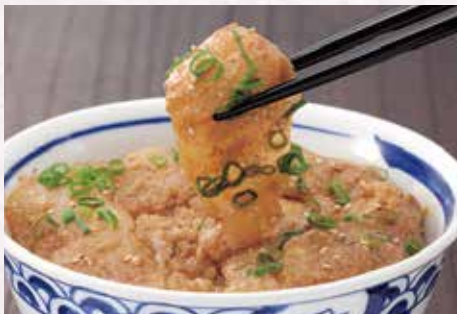
先ずは魚の食感を楽しむ!