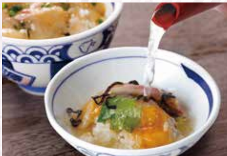
ご飯茶碗に移し、鯛だしをかけてお茶漬けで!

鯛のもつ繊細な味を 帆立の隠し味がほのかに香る 出汁で食べる 源ちゃんの名物です。