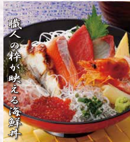
職人の粋が映える海鮮丼

アジフライは日本のソウルフード。もっと美味しくできる。もっと感動してもらえるものになれる。アジ本来の美味しさを生かす為が一番美味しいと感じ、弾力ある身を維持するように手付衣にこだわります。