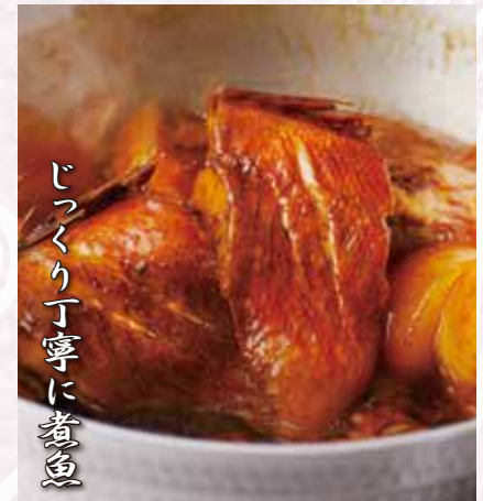
じっくり丁寧に煮魚

より深く、海鮮丼に思いを馳せてみる。まずは日本人の精神文化そのものを支える米。そしてその上に乗せられる海鮮素材は魚市場より仕入れる。それらを一つの器の中で調和せしめ、より高次元な味わいを創造します。