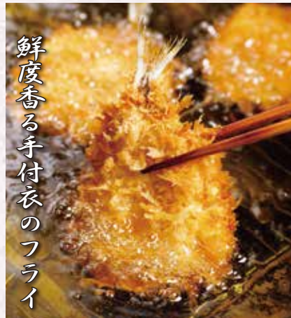
鮮度香る手付衣のフライ

豊洲・各市場直送の新鮮な魚介をお手頃価格でお楽しみいただけます。毎朝市場から届いた新鮮な魚介を店内解体にこだわり、職人仕込の味と技を、一皿一皿に心を込め「安心」「安全」「美味しい」を追求していきます。