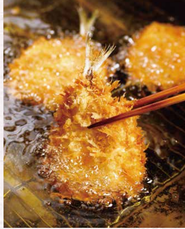
一枚一枚、黄金色に仕上げます。

市場直送の 新鮮なアジを こだわりのパン粉を手付けし サクツとした食感と ふわふわぷりぷりの 素材の美味しさを 堪能できます。