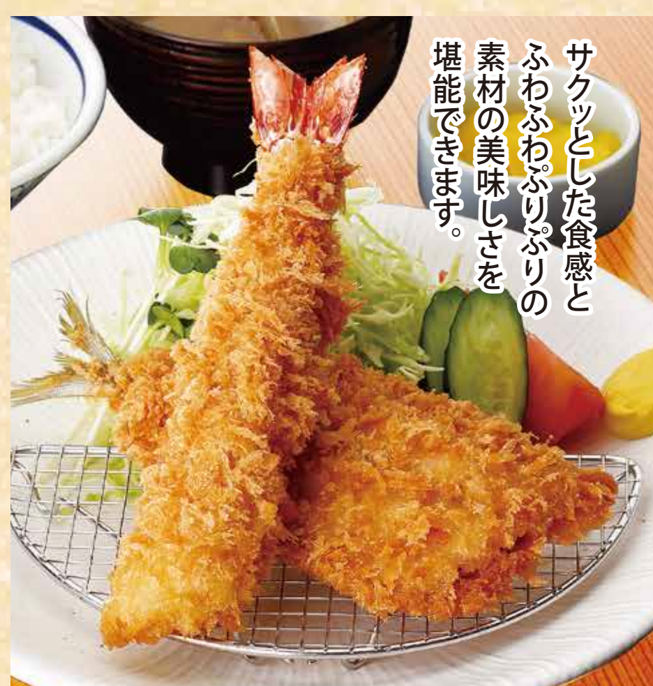
アジフライと海老フライ定食