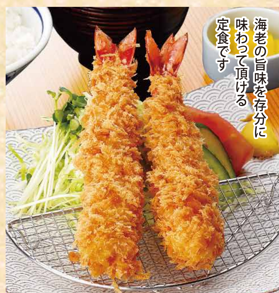
特大海老フライ定食