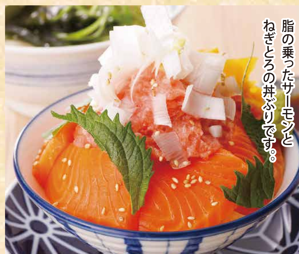
サーモンねぎとろ丼セット