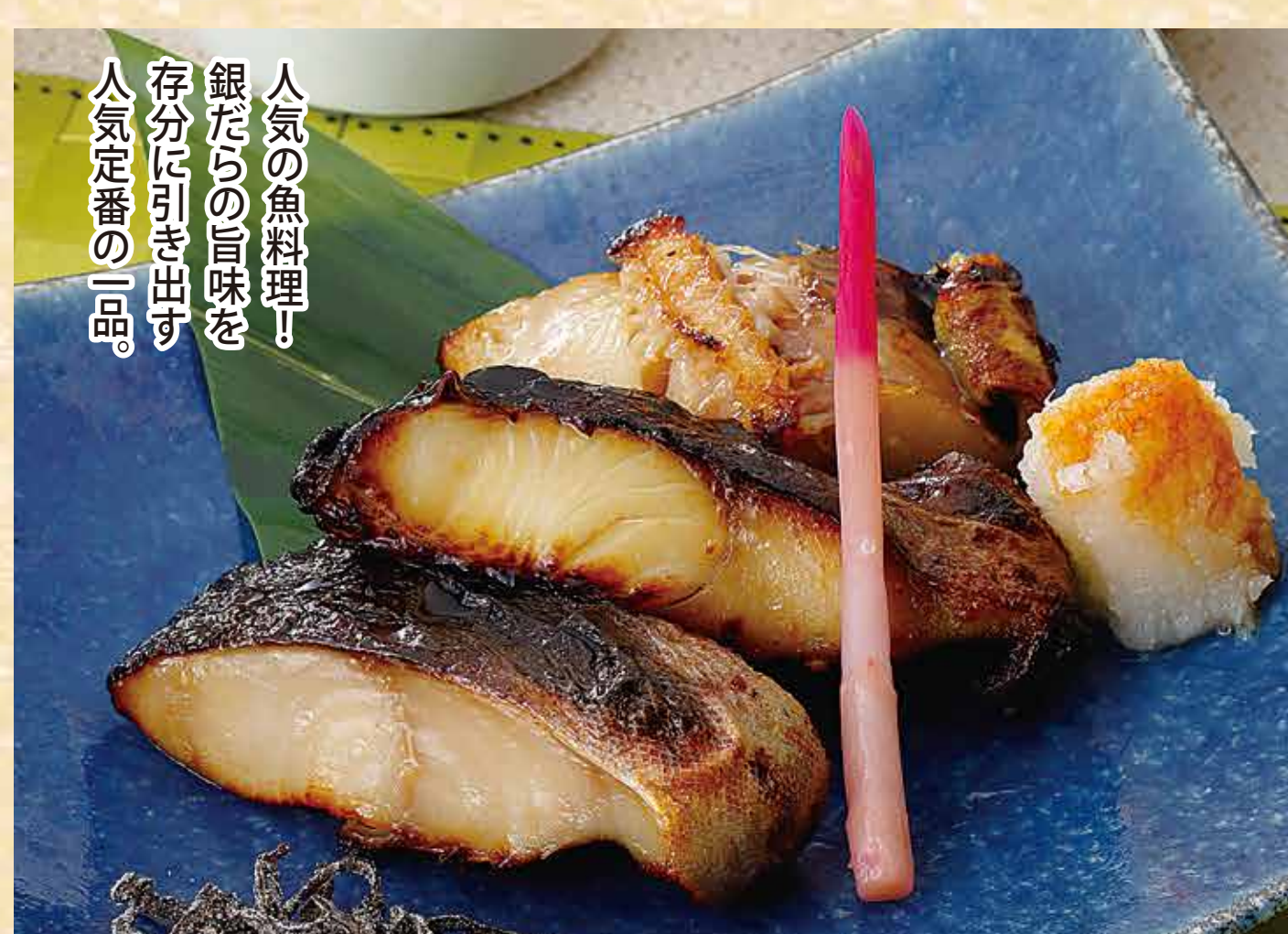
銀だら西京焼き定食