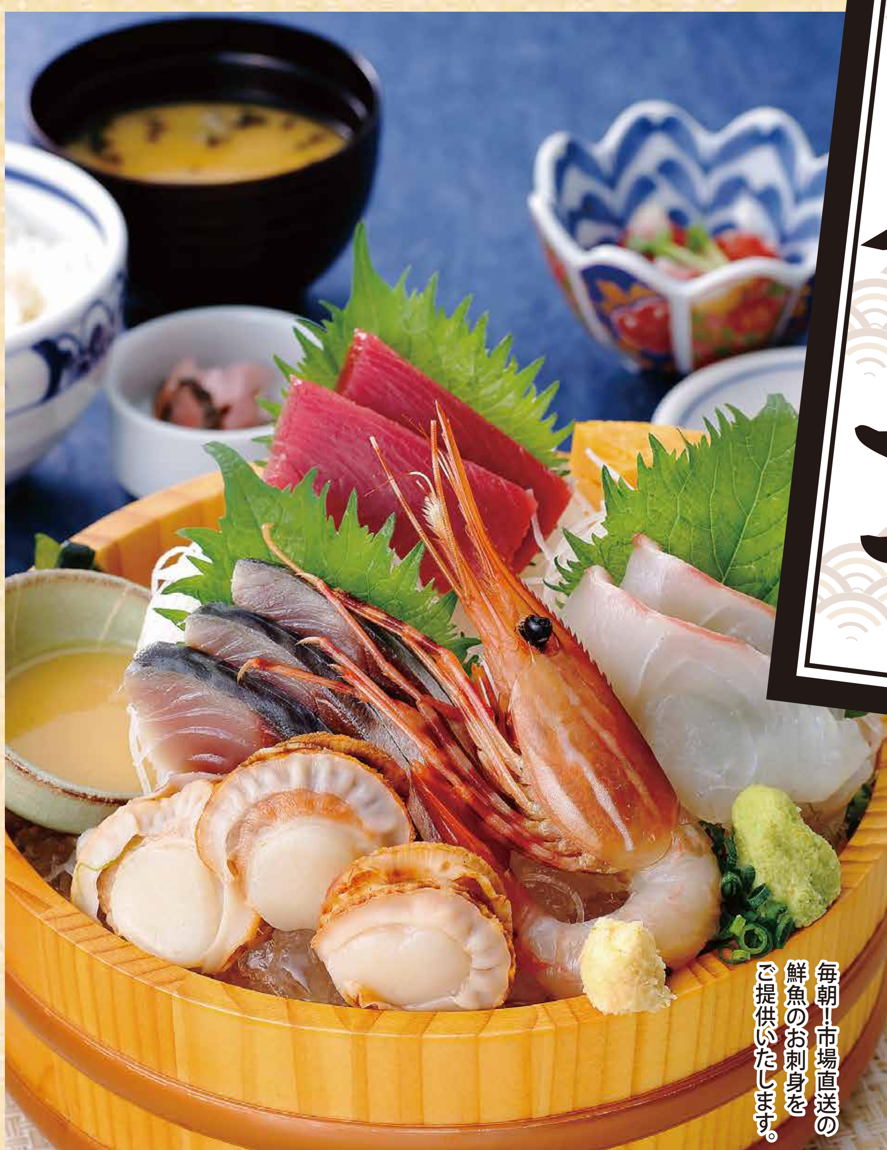
本日のお刺身定食