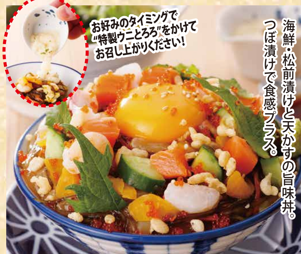
旨味あられ丼セット