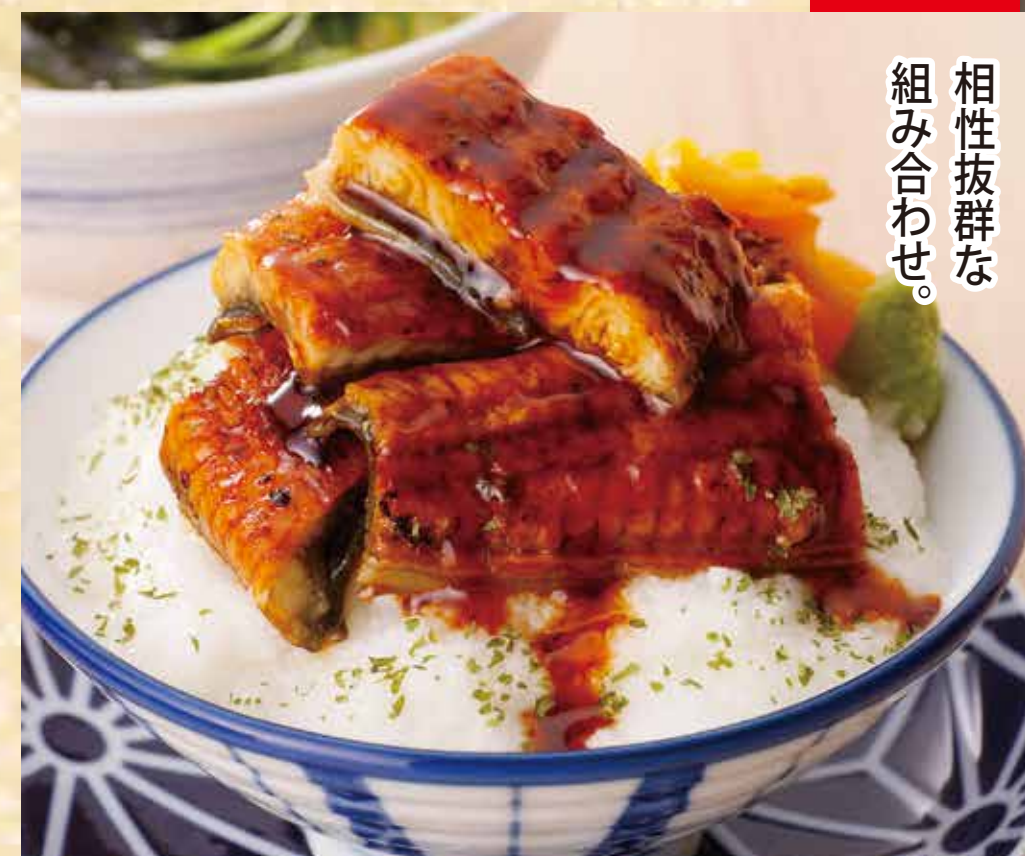
鰻うなぎとろ丼セット