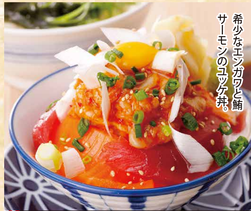
まぐろ・サーモンえんがわユッケ丼セット

セットは 「手延べ勝りうどん」又は 「からあげ&味噌汁」の いずれかをご賞味 いただけます