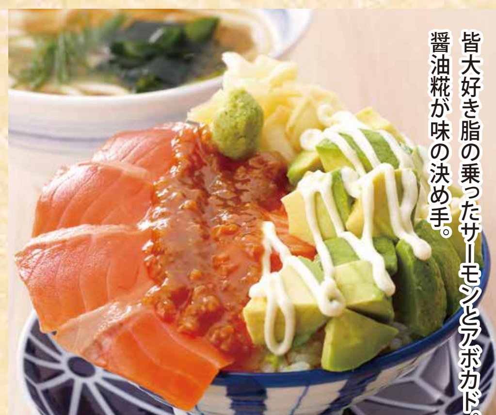
サーモンアボカド醤油糠井セット