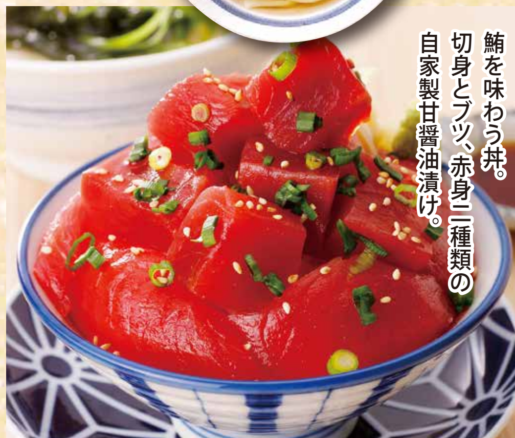
まぐろ漬け丼セット