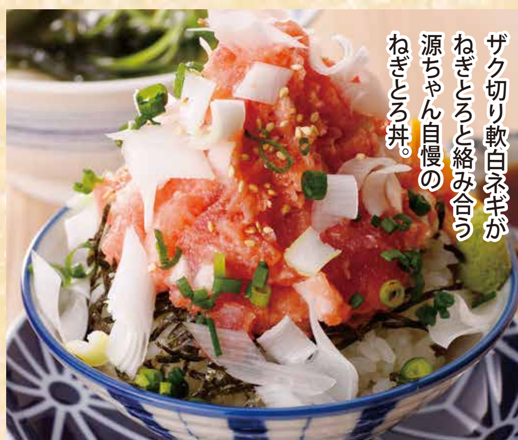
源ちゃんねぎとろ丼セット