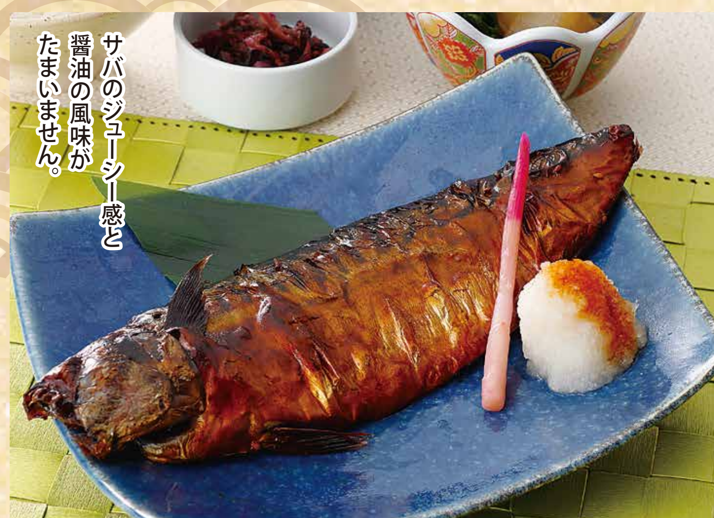
焼きトロさば定食