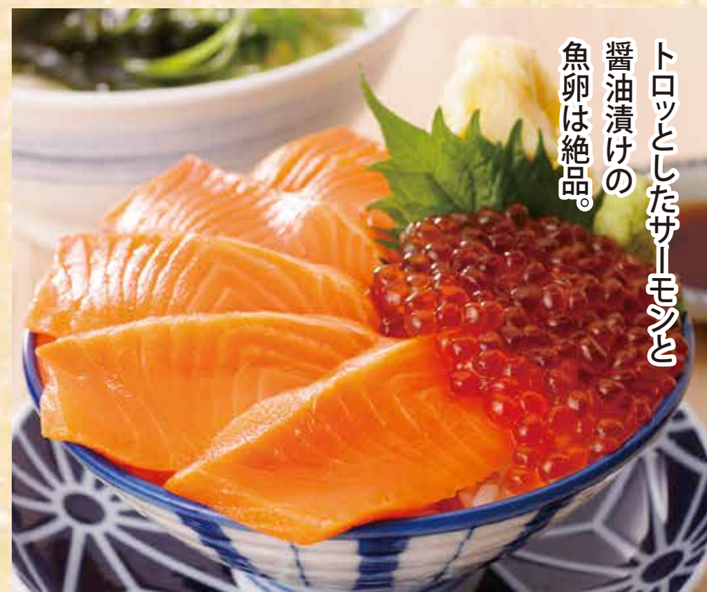
サーモン親子丼セット